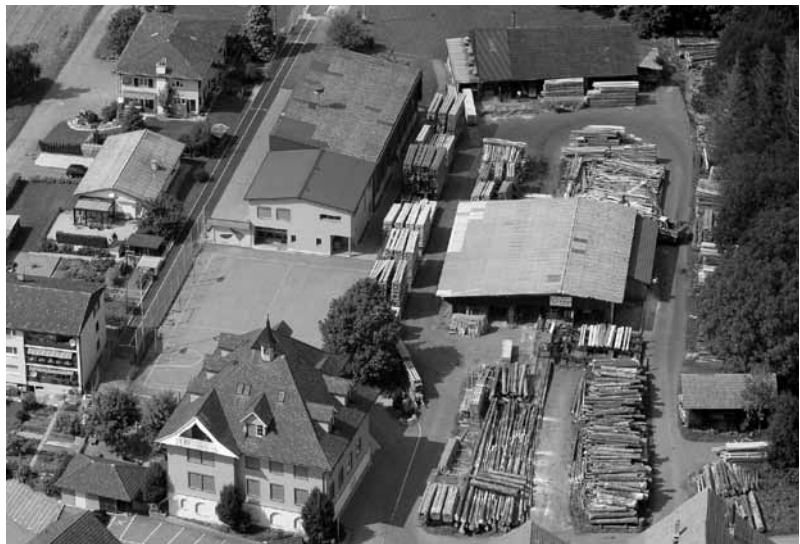
Das Schul- und Sägereiareal aus der Vogelperspektive

Aus raumplanerischer Sicht ist die Aussiedlung des Sägereibetriebs erwünscht. Eine Zone für öffentliche Zwecke oder für Wohnzwecke würde dem Charakter und der Nutzungsidee des Dorfzentrums besser entsprechen. Josef Amhof gibt seinen Sägereibetrieb anfangs 2011 auf. Er hat der Gemeinde Hitzkirch, im Wissen um die vorstehenden historisch gewachsenen Nutzungskonflikte, den Kauf des Sägereiareals angeboten.