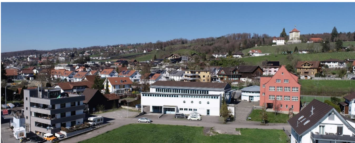
Abbildung: Blick von Westen zur Schulanlage Gelfingen mit dem denkmalgeschützten «Schulhaus Meili». Im Hintergrund am Hang das Schloss Heidegg.

Das Bauvorhaben darf als Generationenprojekt bezeichnet werden. Dem entsprechend richtet sich die Planung an einer langfristigen Betrachtung aus.