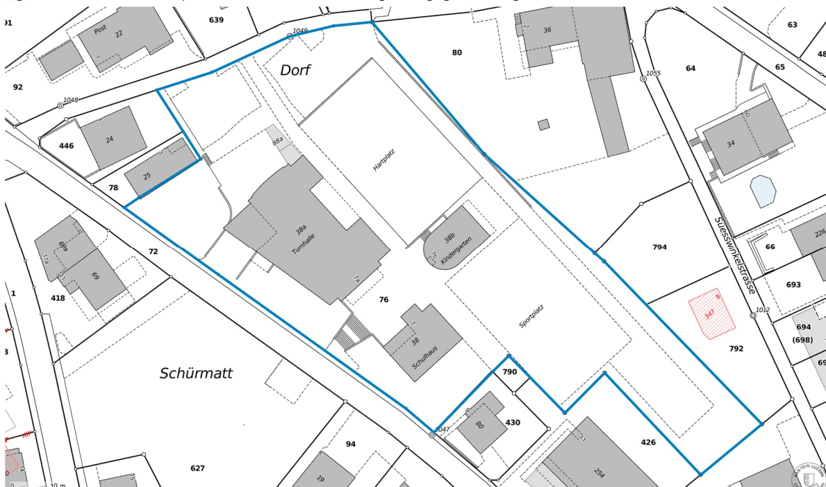
Abbildung: Situation; ohne Massstab. Planungs- und Betrachtungsperimeter in blau. Siehe auch «5.10 Denkmalschutz/ Denkmalpflege. Kulturdenkmal».

Der Planungs- und Betrachtungsperimeter umfasst die Parzelle mit GB-Nr. 76. Eine gesamtheitliche Betrachtung mit kleinem Gebäudefussabdruck ist zentral: Der Freiraum mit möglichst grossflächigem Hartplatz (und grossflächigem Rasenplatz) ist ein zentrales Anliegen der Gelfinger-Bevölkerung und für die Akzeptanz wichtig. Siehe dazu auch Kap. «5.9 Freiraum- und Umgebungsgestaltung».