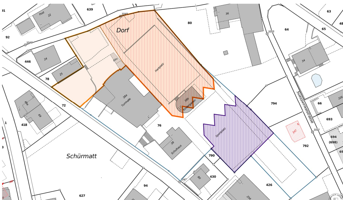
Abbildung: Ohne Massstab. Auszug «Machbarkeitsstudie MB» und «Ergänzung zur Machbarkeitsstudie»: Bauperimeter/ «Baufelder». Vgl. Anhang «E Machbarkeitsstudie».

_Die Rückseite des Meili-Schulhauses muss unbebaut bleiben.